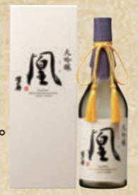
蔵元最高峰 澤之井 大吟醸 風