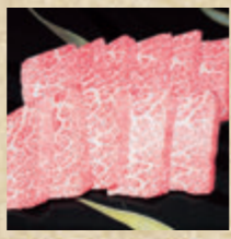
【特賞】超希少 秋川牛