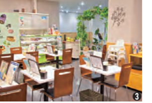
①野菜が美味！武蔵野やさいのサラダ ②12種類以上のベジタブルスイーツが並び ③テーブル席のほか、小上がりもある