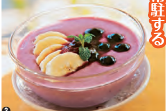
①日替わりランチはなくなり次第終了 ②心と身体、環境にも優しいカフェ ③マキベリーヨーグルトも人気