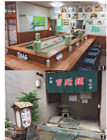
①店内はコの字型カウンター席のみ ②翡翠麺と同じ緑色ののれんが目印 ③人気メニューの麺と手打三色大餃子