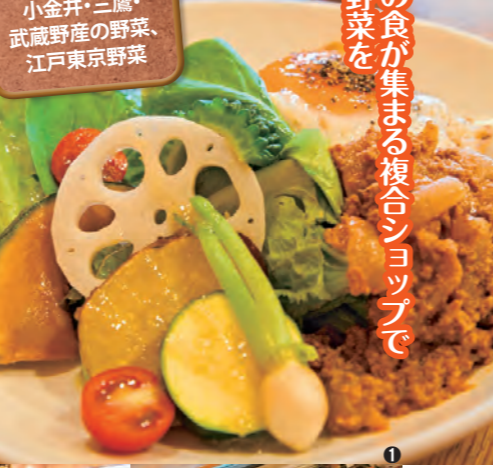
①季節の野菜をたっぷり盛り込んだB丼800円。写真はナシゴレン ②1階のショップで買った弁当や惣菜は2階でいただくことも ③店内は木の温もりが感じられる空間