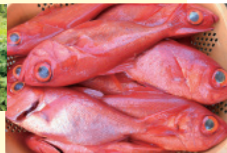
キンメダイやマグロといった高級魚が多く水揚げされる