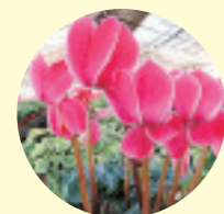
都内最大のシクラメン産地である瑞穂町。岩蔵街道には園芸店が並び、「シクラメン街道」と称される