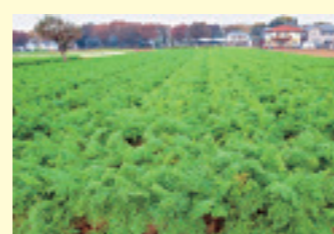
清瀬市はニンジンの生産量都内一を誇る

東京の特産物として全国的に名高い東京ウドをはじめ、ナシやブドウ、ブルーベリーなどが栽培され、フルーツ狩りも楽しめる。新鮮な野菜や果物、開花が楽しみな花壇苗を大消費地である23区へ届けられるのが都市型農業の強み。