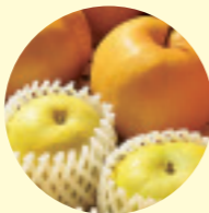
稲城市を中心に作られるナシ「稲城」は、大きくて甘く、果汁たっぷり。めったに市外には出回らない「幻のナシ」だ