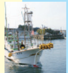
複雑な海底地形や黒潮の影響により、日本有数の好漁場が形成されている