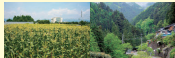
あきる野市の五日市街道は通称「トウモロコシ街道」とよばれる産地 西多摩エリアには良質な多摩産材を育む豊かな森林が広がっている

滝や渓谷、鍾乳洞など、美しい自然景観が広がるエリア。野菜はもちろん、花や茶葉、山間部ではワサビも生産され、清流には川魚が泳ぐ。酪農や魚の養殖、林業も行われ、東京の農林水産業がギュッと凝縮している。