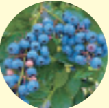
小平市はブルーベリー栽培発祥の地。摘み取りできる農園も多い