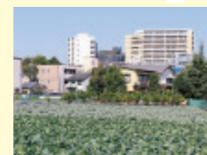
コマツナは現在の江戸川区が発祥の地。小松川周辺に鷹狩りに訪れた8代将軍徳川吉宗の命名と伝わる

東京都心部にも畑が残り、江戸川区産のコマツナや練馬区産のキャベツをはじめとした特産物も存在する。フルーツやシクラメンなどの鉢花や花壇苗、切り花の栽培も盛んだ。東京産の食材を味わえる名店も多い。