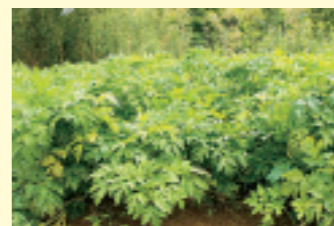
今日摘んでも明日には新しい葉が出るといわれるアシタバ

伊豆諸島と小笠原諸島の島々は、温帯から亜熱帯までの変化に富んだ気候帯にある。アシタバをはじめ、パッションフルーツやレモンなど、島ならではの農産物が栽培されている。また、国内屈指の好漁場でもあり、海の幸も豊富。