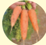
コクがありニンジンくささがなく芯まで赤いベータカロット