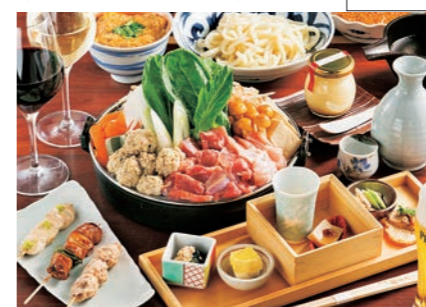
東京しゃもの焼鶏とすき焼き龍馬鍋が堪能できる飲み放題付「東京軍鶏 両国コース」5100円(注文は3人前~)