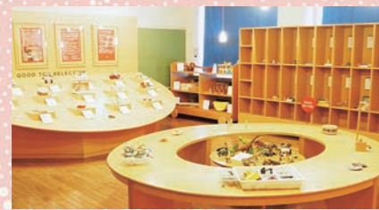
国内外の優れたおもちゃを揃えた「グッド・トイてんじしつ」