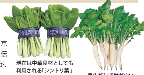
現在は中華食材としても利用される「シントリ菜」

江戸時代から昭和40年(1965)頃にかけて東京近郊で栽培され、住民の食生活を支えてきた伝統野菜。収穫量が少なく栽培に手間がかかるが、貴重な食材として注目されている。