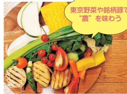
農園から直接届く新鮮野菜を「生・蒸し・焼き」の3つの調理法で味わう「バーニャカウダ」1980円

港区 東京野菜キッチンSCOP ●とうきょうやさいきつちんすこっぷ ☎03-6435-5304