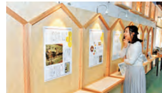
季節の花々から蜜を集めてくるミツバチの働きなどを学べる

☎042-519-9327 ●あきる野市上ノ台37-3 ●JR武蔵増戸駅(JC85)から徒歩10分 ●10時30分~17時 ●水曜 ●13台