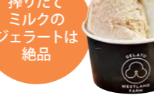
搾りたてミルクのジェラートは絶品

●西多摩郡瑞穂町長岡長谷部353-3 ●JR箱根ヶ崎駅から車で6分 ●10時30分~17時 ●水曜 ●14台