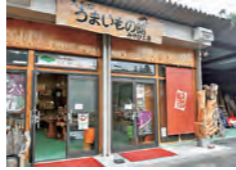
燻製に用いる桜チップのいい香りが漂う