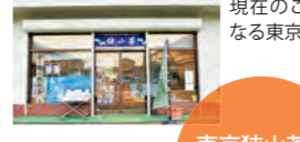
「やぶきたのぼる」100g1080円などの銘茶も数多く揃う