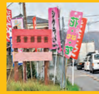
シクラメン街道ではビニールハウスに立ち寄りながらドライブを楽しもう