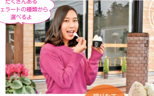
店内のイートインスペースや外のベンチで味わおう