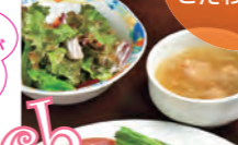
「TOKYO X ランチ」1512円。ソーセージ、ハム、ベーコン、カツレツを味わえる

●福生市福生785 ●JR福生駅(JC57)から徒歩3分 ●レストランは11時30分~14時、17時30分~21時30分(土・日曜、祝日は11時30分~15時、17時~21時30分) / ショップは10時~21時30分(火曜は~16時30分、土・日曜、祝日は11時30分~) ●火曜(ショップは無休) ●11台