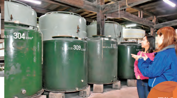
明治13年(1880)に建てられた本蔵内で酒造りについて解説を聞ける