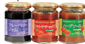
ブルーベリージャム 260g 880円も人気