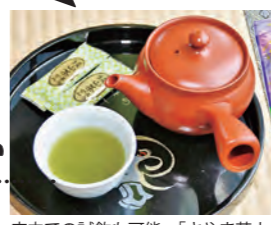
店内での試飲も可能。「さやま茶ようかん」8本 486円も人気だ

●福生市熊川11 ●JR 西武拝島駅(JC55-S536)から徒歩20分 ●多満自慢見学コース700円(ウェブサイトより要予約) ※ほかコースにより異なる ●直売店は10~18時、レストランは11時30分~20時30分LO ●火曜(直売店のみ12月は無休) ●30台