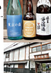
門を抜けると目の前に本蔵が見える。敷地内に直売店やレストランを併設