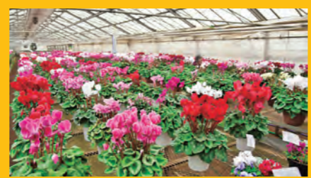
長谷部園芸のビニールハウスに並ぶ色とりどりのシクラメン。値段はミニ500円~8号鉢8000円

●西多摩郡瑞穂町長岡長谷部118 ●JR箱根ヶ崎駅から車で5分 ●11月~12月下旬の9時~17時30分 ●期間中無休 ●15台