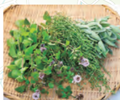
西東京市の住宅街では都市農業ならではのハーブ栽培