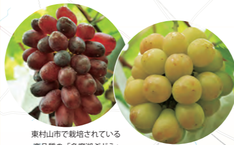
東村山市で栽培されている高品質の「多摩湖ぶどう」