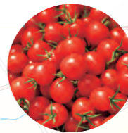
ハウスで丁寧に栽培されている清瀬市のトマト