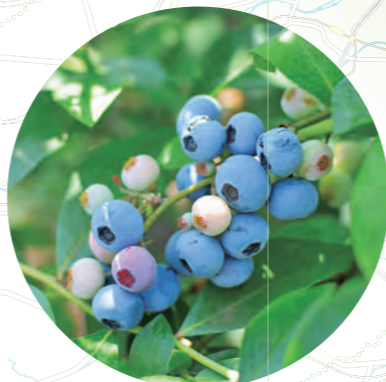
小平市は日本におけるブルーベリー経済栽培発祥の地