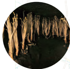
江戸東京野菜「東京ウド」の生産量は立川市が都内1位