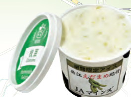
狛江市特産のエダマメは甘みが強く、加工品も人気