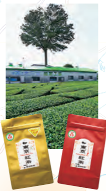
東大和市で栽培されている東京狭山茶でつくられた「東京紅茶」