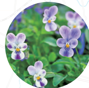
東久留米市や東村山市では花壇苗の栽培が盛ん